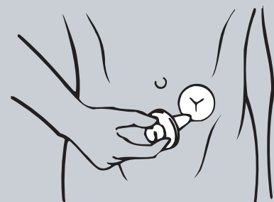
Modalità d'uso dei dilatatori DILASTOM® Direction for use of dilator DILASTOM®